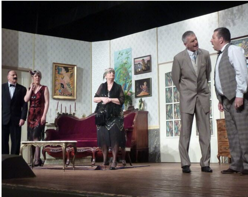
Le talentueux jeu des acteurs suscite de chaleureux applaudissements

Les Dernières Nouvelles d'Alsace - 08 nov. 2023 à 17:00 - Temps de lecture : 2 min